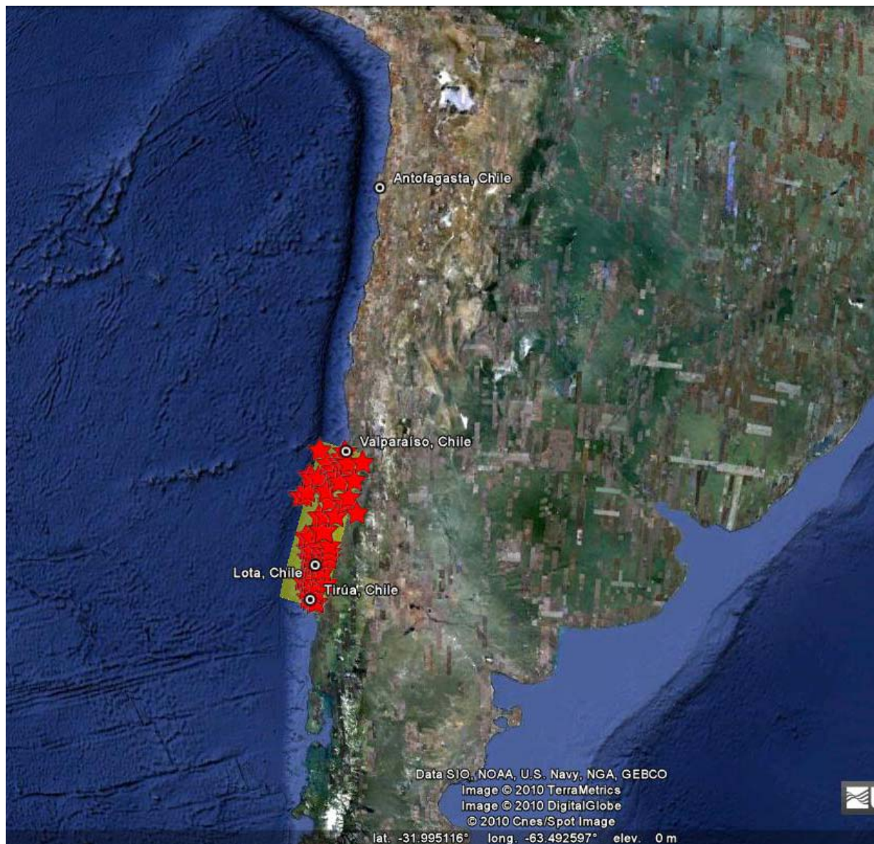
Figura 1. Distribución de replicas del terremoto del Maule, rectángulo amarillo plano de ruptura. Basada en los datos entregados por el National Earthquake Information Center de Estados Unidos.

mismas. En este caso la ruptura excede el largo de la laguna sísmica de Concepción y Constitución. El largo de la ruptura del terremoto del Maule Mw 8.8 estuvo fuertemente controlado por la orientación de la fosa, la cual tiene cambios de rumbos al norte y al sur que coinciden con los puntos de término de la ruptura.